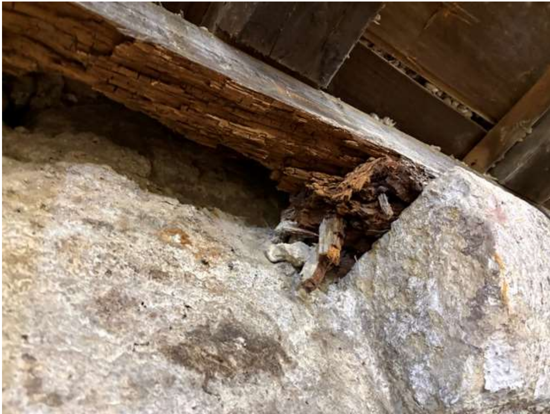
Morscher Balken UG

Dokument zu Nachtragskredit Einwohnerrat 04. Mai 2026