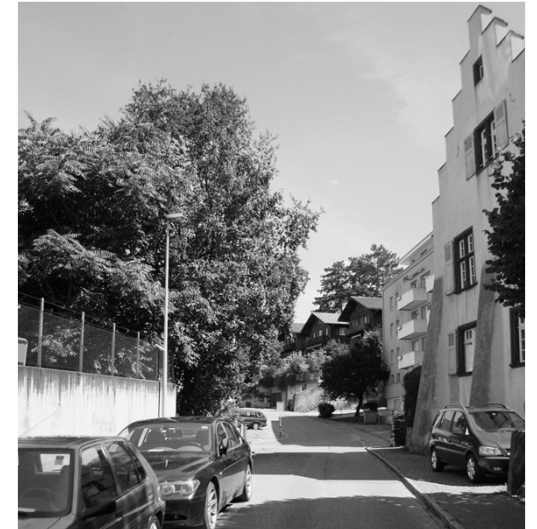
heutige Situation vor Holeeschloss