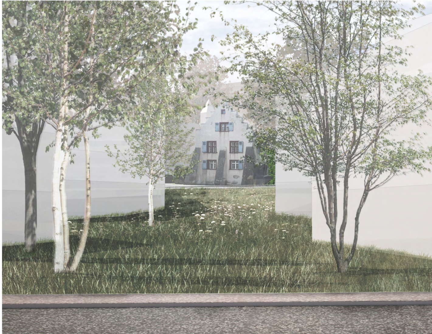
Dorenbachstrasse / Holeeschloss