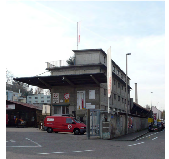
Eingang zum Stamm- Areal