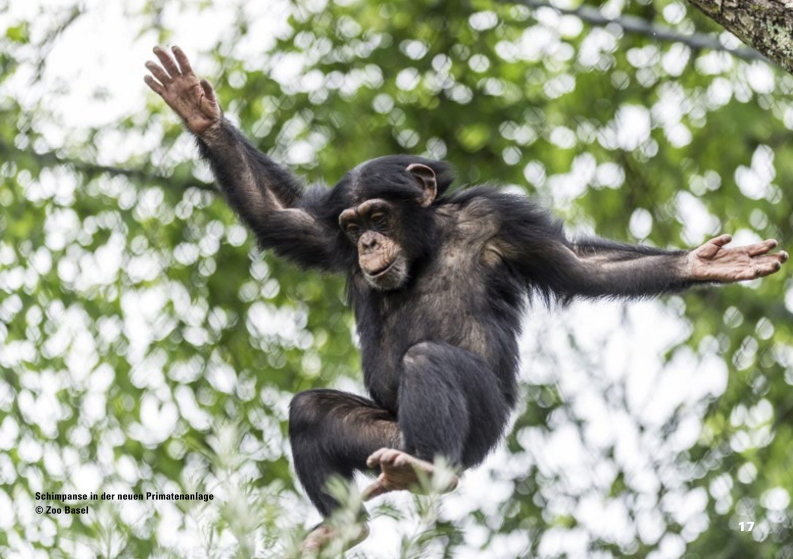
Schimpanse in der neuen Primatenanlage