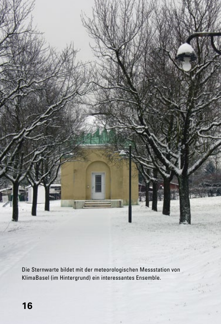
Die Sternwarte bildet mit der meteorologischen Messstation von KlimaBasel (im Hintergrund) ein interessantes Ensemble.