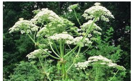
Berce du caucase Riesenbärenklau

Les plantes invasives ont un impact environnemental, sanitaire et économique importants. Il est nécessaire de limiter leur développement par l'arrachage systématique de ces plantes par exemple arracher et mettre aux ordures ménagères)