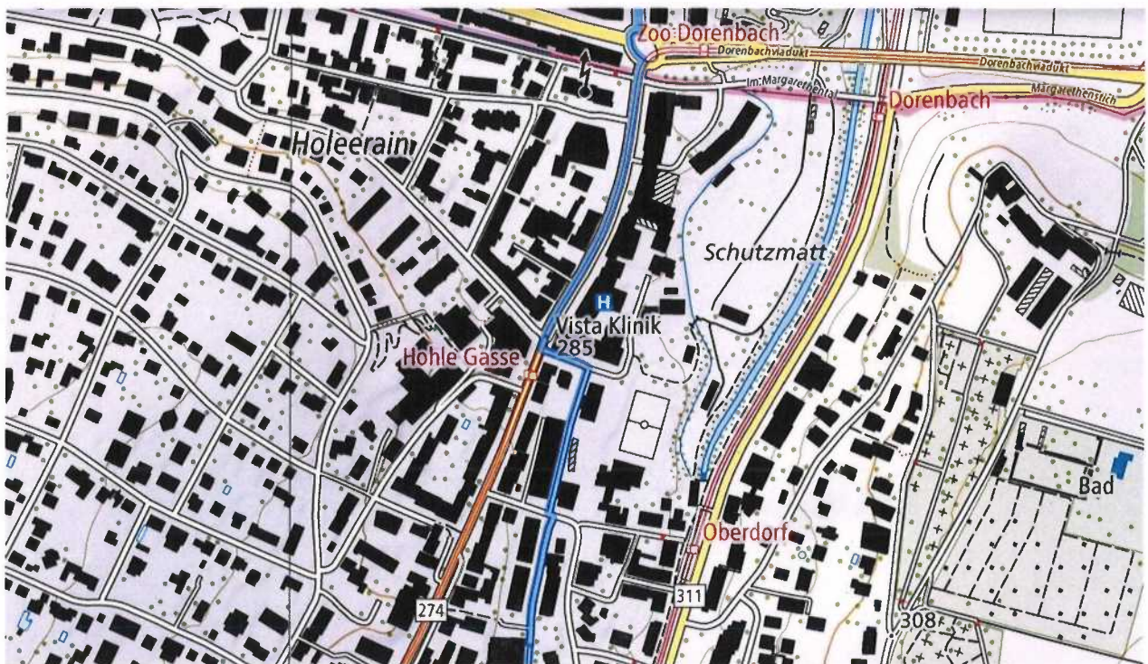
Abb. 1: Führung der nationalen Veloroute 7 durch Binningen (blaue Linie)

Es handelt sich um den Radweg von Binningen-Bottmingen. Er ist auch Teil der nationalen Rad-Route Nr. 7 (Jura-Route Basel–Nyon).