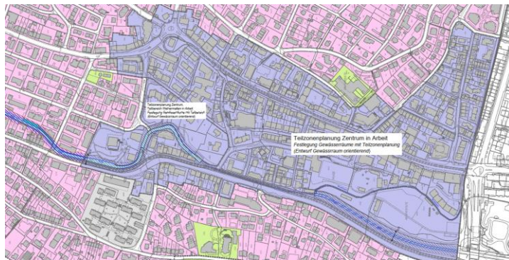
Areal der Teilzonenplanung Zentrum

Mit der Teilzonenplanung Zentrum (inkl. Teilbereich "Weihermatten" innerhalb der Teilzonenplanung Zentrum) wird der Gewässerraum für die darin enthaltenen Gewässer Birsig, Dorenbach und Rümelinbach in einem separaten Verfahren festgesetzt und beschlossen (violette Fläche). Im Rahmen des Mitwirkungsverfahrens wurden die vorgesehenen Gewässerräume für die Gewässer innerhalb der Teilzonenplanung zusätzlich dargestellt (zwecks Übersicht), jedoch ohne präjudizierende Wirkung für die Verfahrensschritte der Teilzonenplanung.